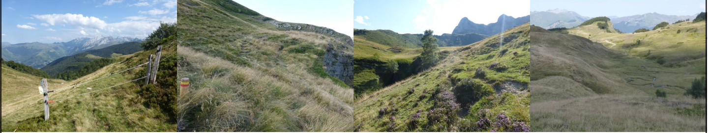
La clôture du Col d'Arrioutort