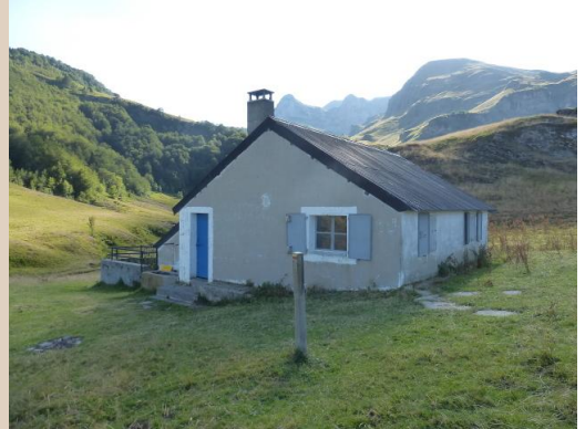
La Cabane d'Arrioutort et en toile de fond les escarpements du Montagnon d'Iseye et du Pic Lasnères

A u départ du stationnement du Barca, Prendre l'itinéraire du Pic de Lasnères par les Cabanes de Cure deth Cam jusqu'au Col d'Arrioutort, le traverser, puis suivre au fond et à droite le sentier du Tour de Pays de la Vallée d'Ossau jusqu'à la Cabane d'Arrioutort. En fin de parcours, une belle cascade resurgit du plateau supérieur. Dans le plateau inférieur, l'eau décrit des méandres d'où le nom d'Arrioutort.